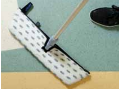
Sweep Duo Hygiene Plus 35 cm, 140696 Sweep Duo Hygiene Plus 50 cm, 140697