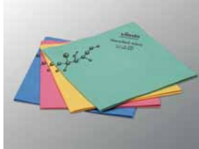
NanoTech micro blå, 128601 NanoTech micro rød, 128603 NanoTech micro grøn, 128602 NanoTech micro gul, 128601