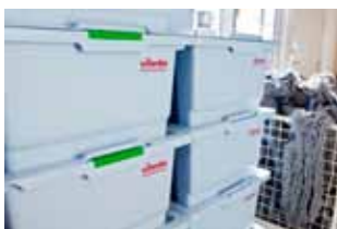
Box 15 L med låg Viledas box med låg er ideel til opbevaring af mopper og klude, som kan anvendes direkte på pladsen. Kan farvekodes.

Fyld de vaskede mopper eller klude i en tæt beholder til de skal bruges næste dag.