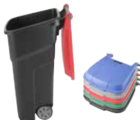
ATLAS 100 L beholder på hjul. Kan farvekodes via valg af låg. Sort, grøn, rød, blå og grå.