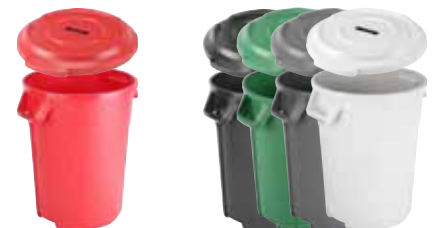
TITAN Beholder med låg fås i 85 og 120 L. Kan farvekodes. Beholder og låg kan valgfrit kombineres. Rød, grøn, sort, grå og hvid.